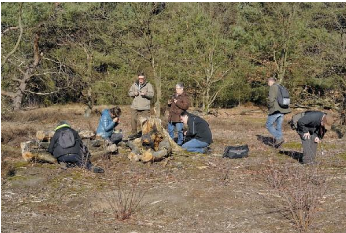
Maar na zo een vermoeiende 200m stappen moesten er al een deel even gaan zitten!