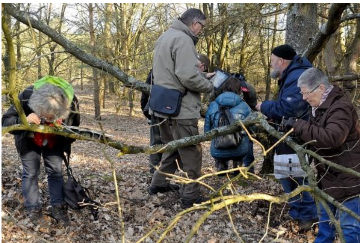
Bij aanvang ging het nog allemaal heel goed